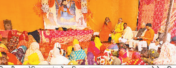
भिवानी। आयोजित सत्संग में उपस्थित श्रद्धालु।