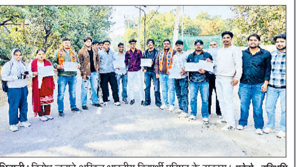
भिवानी। विरोध जताते अखिल भारतीय विद्यार्थी परिषद के सदस्य।

स्कूल का निर्माण ग्रामीणों ने स्वयं किया ग्रामीणों ने 2020 में श्री सोम नाथ समिति के तहत चंद्रा एकत्रित करके गांव के राजकीय स्कूल के भवन का निर्माण करवाया जिसमें 17 कमरे व एक हाल का निर्माण करवाया था तथा स्कूल में पानी की टंकी का निर्माण भी करवाया था। ग्रामीणों का कहना है कि अब राजनिर्मित के चलते अध्यापकों का तबादला किया जा रहा है और गांव के बच्चों को शिक्षा से दूर किया जा रहा है। 25 बच्चों से 500 बच्चों का करवाया दखिला जून 2020 के करेना काल में जिस तरह गांव डूडीवाला किशनपुरा के ग्रामीणों ने मिलकर एक अनेकों पहल के तहत मिशन सरकारी स्कूल वाककर गांव के सभी बच्चों का दखिला सरकारी स्कूल में करवाया गया। जिससे स्कूल में कक्षा 6 से 8 में मात्र 25 बच्चे थे। स्कूल में 500 बच्चों का दखिला करवा कर स्कूल को अपवोड करवा सीनियर सेकेंडरी बनवाया गया। दिसंबर 2021 को अपवोड हुआ स्कूल ग्रामीणों ने बताया कि सरकार के सहयोग को देखते हुए। ग्रामीणों ने 17 कमरे व एक हाल, पानी की टंकी का निर्माण करवाकर शिक्षा सरकारी सहायता के राजकीय स्कूल के भवन का निर्माण करवाया था जिसकी देखभाल हुए प्रदेश सरकार ने दिसंबर 2021 में गांव के राजकीय स्कूल को माडल संस्कृति स्कूल का दर्जा देते हुए स्कूल को अपवोड किया और 12 वीं तक की कक्षा गांव के विद्यालय में शुरू हुई, लेकिन अब स्कूल में राजनिर्मित के चलते अध्यापकों का दबावला किया जा रहा है जो किसी भी सुरत में सहन नहीं होगा।