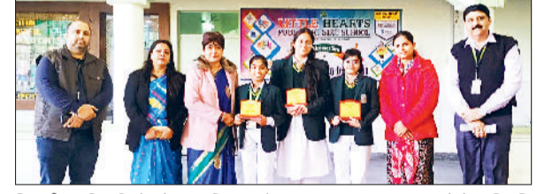
भिवानी। प्रतिभागियों को सम्मानित करते हुए।