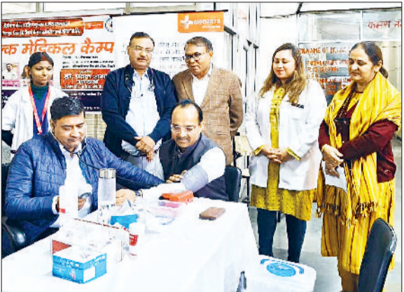
भिवानी। शिक्षा बोर्ड में आयोजित शिविर में जांच करवाते हुए।