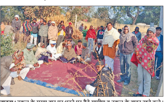
बाढ़ड़ा। स्कूल के मुख्य द्वार पर धरने पर बैठे ग्रामीण व स्कूल के बाहर खड़े बच्चे।