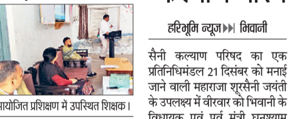
आयोजित प्रशिक्षण में उपस्थित शिक्षक।