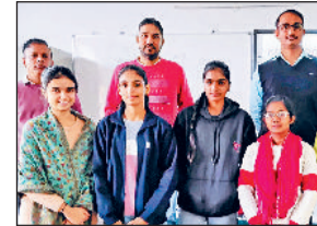
प्रतियोगिता की विजेता छात्राएं।